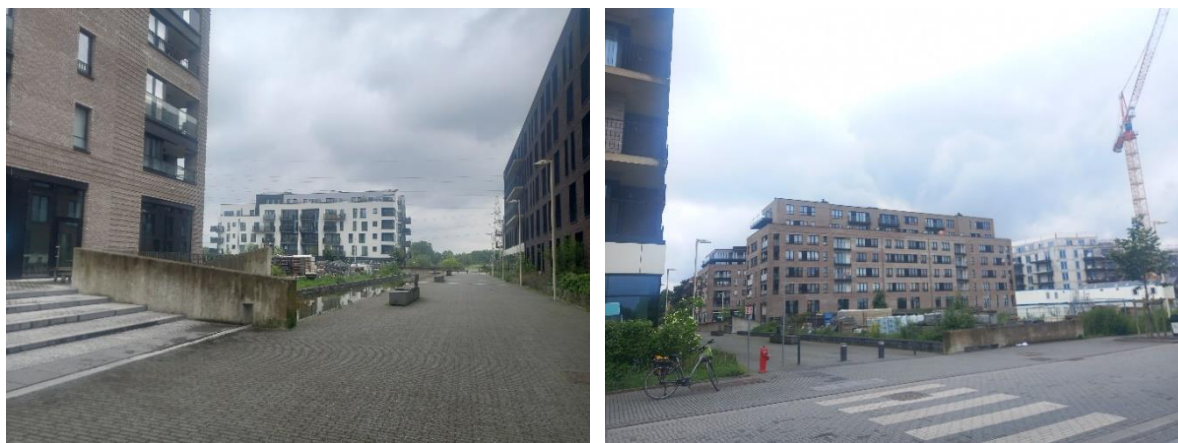
Ceci n'est pas un écoquartier

Dès lors, le PPAS n'a plus de raison d'être et le résultat atteint aujourd'hui est loin des objectifs initiaux. Beaucoup de béton - les surfaces extérieures sont presque entièrement minérales, des locaux commerciaux vides, pratiquement aucun équipement collectif, un bassin en béton et une verdure artificielle qui n'a aucune valeur en termes de biodiversité.