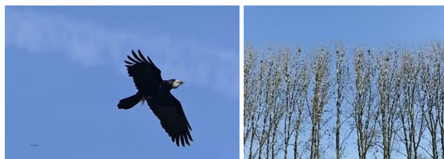
Corbeau freux à Neerpede 04 05 2023 Peupleraie avec les nids de corbeaux freux

https://www.change.org/p/peupleraie-de-212-individus-212-populieren/u/31752730