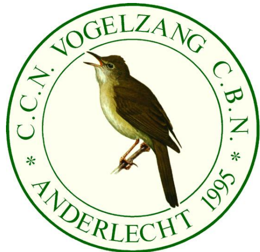
Sigle de fondation de notre association Logo van onze vereniging

Eerst en vooral BEDANKT aan iedereen die ons heeft geholpen om onze doelstellingen voor het behoud van de natuur in de Vogelzangbeekvallei te bereiken - op welk niveau dan ook! Dank ook aan de gidsen die ons helpen om de biodiversiteit van de site te ontdekken tijdens de rondleidingen die we organiseren.