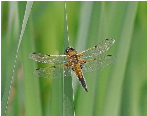
Libellule à quatre taches – Libellula quadrimaculata

Et au Meylemeersch, d'autres espèces pourront vous charmer ! Voici quelques exemples...