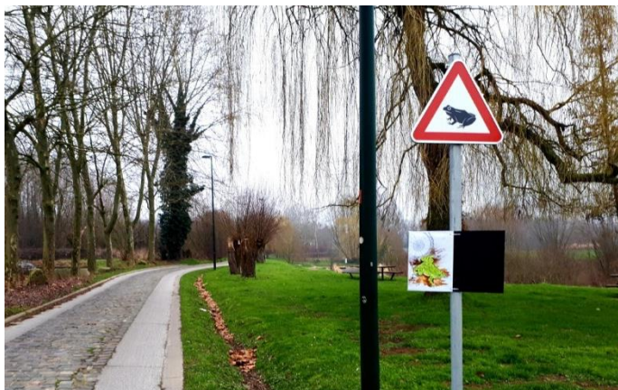
Panneaux de signalisation routiers

Les flux de population au sein même de la réserve ne sont pas étudiés, car les batraciens s'y déplacent en sécurité.