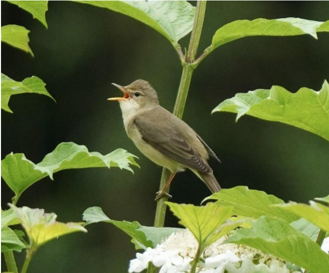
Rousserolle verderolle 22 05 2023 (Meylemeersch)

Avant tout, mille fois MERCI à ceux et celles qui nous ont aidés à atteindre nos objectifs pour préserver la Vallée du Vogelzangbeek – que ce soit à n'importe quel niveau ! Merci aussi aux guides qui nous ont fait découvrir la biodiversité du site lors des visites guidées que nous organisons.