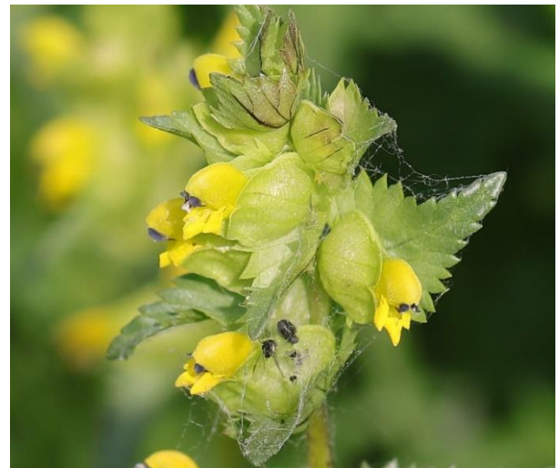
Kleine ratelaar – Rhimanthus minor

En in de Mijlemeers zullen andere soorten je zeker ook bekoren! Hier zijn enkele voorbeelden...