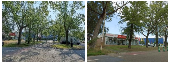
Allée Hof ter Vleest – Hof ter Vleestdreef

https://www.change.org/p/peupleraie-de-212-individus-212-populieren/u/31752730