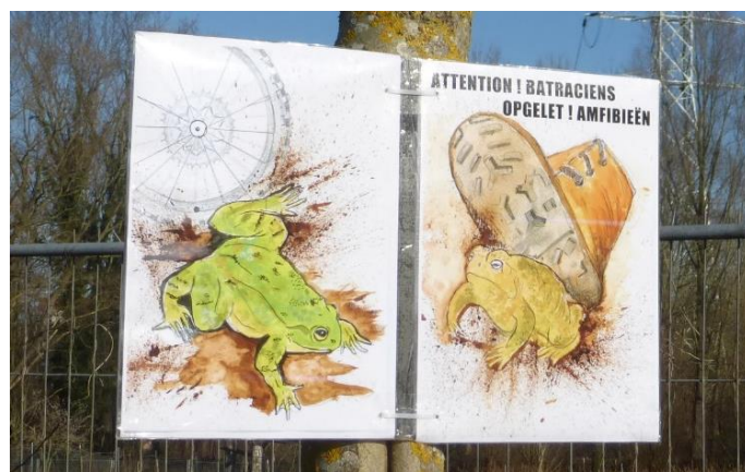
« Preventie » tekeningen - Dessins « prévention » © Annick Van Est

De migratiestromen binnen het reservaat zijn niet bestudeerd, aangezien de amfibieën er zich veilig kunnen verplaatsen.